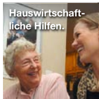
Hauswirtschaft- liche Hilfen.