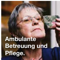
Ambulante Betreuung und Pflege.