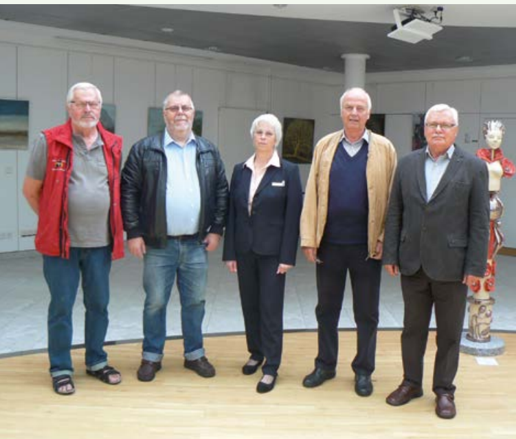
von links nach rechts: SB Wesselburen, 1. Vorsitzender KSB, SB Brunsbüttel, 2. Vorsitzender KSB, SB Hemmingstedt