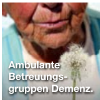
Ambulante Betreuungs- gruppen Demenz.