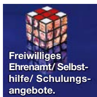
Freiwilliges Ehrenamt/ Selbst- hilfe/ Schulungs- angebote.